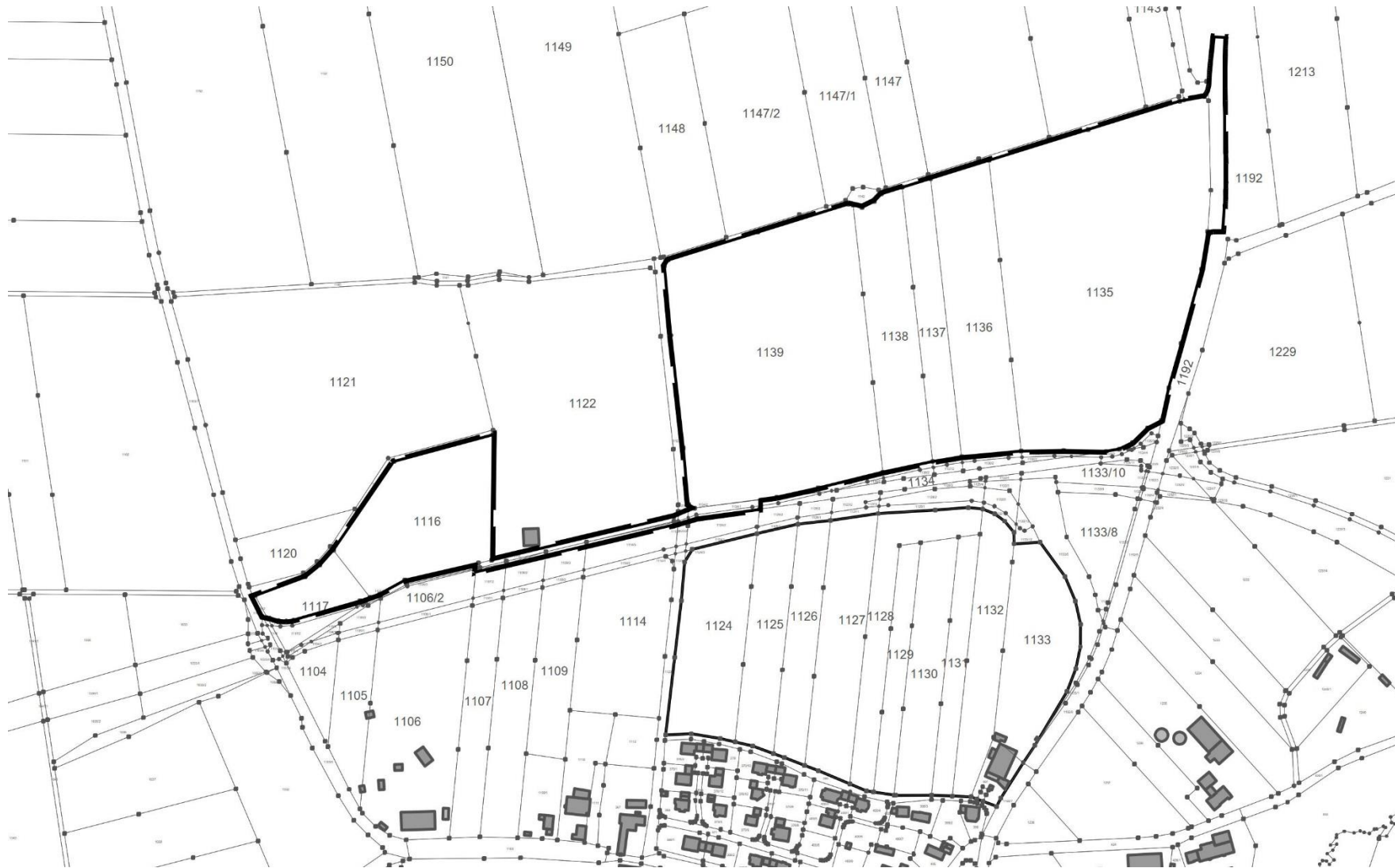
Abbildung 2: Lageplan Geltungsbereich Bebauungsplan (Umgriff Änderung FNP als Hinweis)