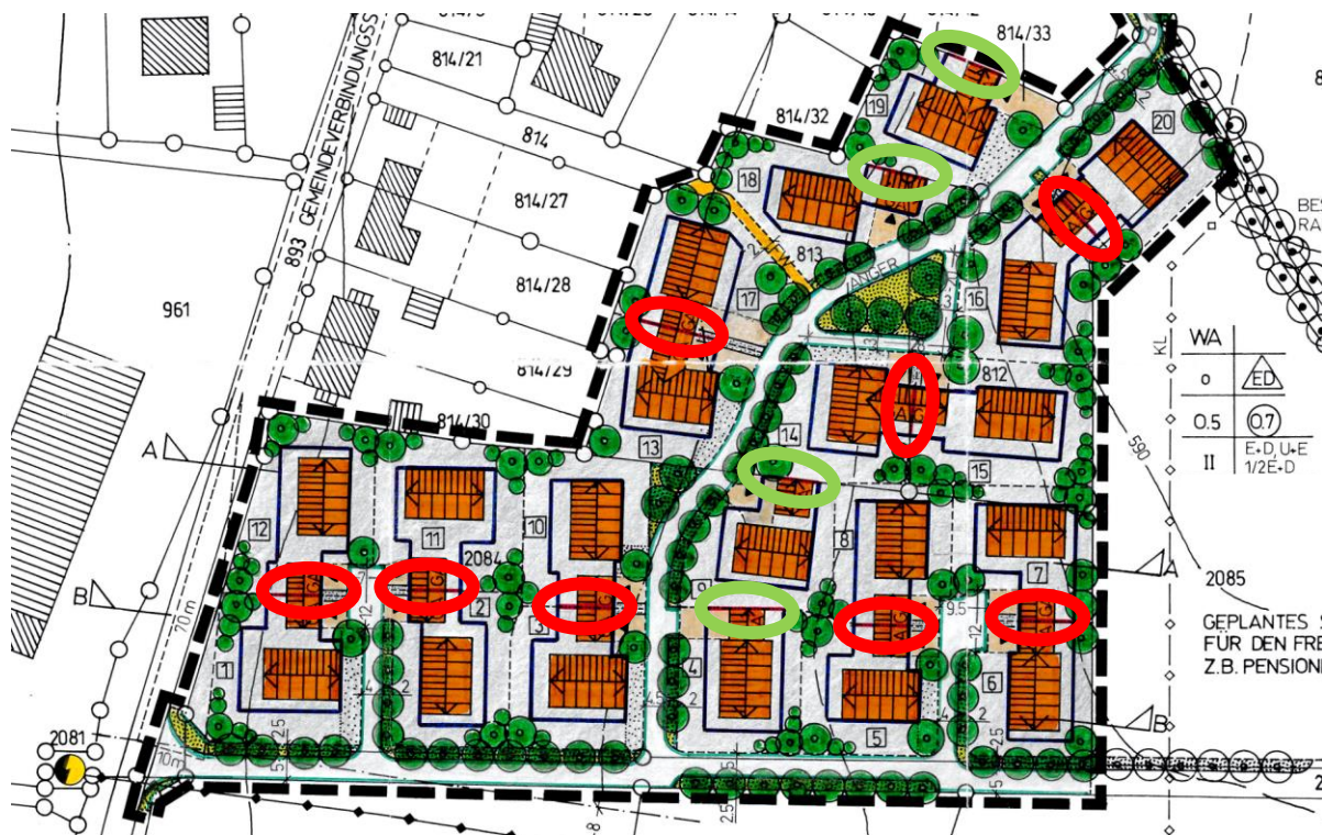
Abbildung 3: Darstellung der Änderung an den Baulinien. In rot: Herausnahme der Baulinien. In grün: Ersatz der Baulinie durch Baugrenzen.

Die ehemalige Festsetzung 4.3.3: Bei Errichtung von Haupt- und Nebengebäude (Garagen) an gemeinsamer Grenze hat sich der Nachbarbauende in Bezug auf die Bauhöhe, Dachneigung, Dachdeckung usw. an das an dieser Grenze bestehende Gebäude anzugleichen, wurde entfernt, um ein „Windhundprinzip“ zu vermeiden und den Grundstückseigentümern mehr Flexibilität einzuräumen.